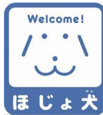
【ほじょ犬マーク】 所管：厚生労働省