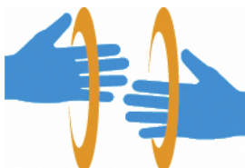
【手話マーク】 所管：一般財団法人全日本ろうあ連盟