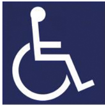
【障害者のための国際シンボルマーク】 所管：公益財団法人日本障害者リハビリテーション協会