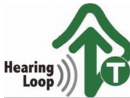
【ヒアリングループマーク】 所管：一般社団法人全日本難聴者・中途失聴者団体連合会