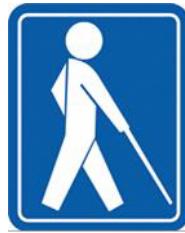
【盲人のための国際シンボルマーク】 所管：社会福祉法人日本盲人福祉委員会