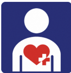
【ハート・プラスマーク】 所管：特定非営利活動法人ハート・プラスの会