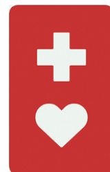
【ヘルプマーク】 所管：東京都