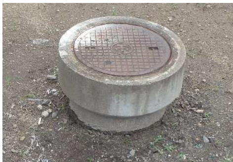
コンクリート製公共汚水柵 (直径30cm 鉄ふた)

官民境界から約1m以内に設置しております。また、ふたの中央には岸和田市の市章『丵』が表記されております。