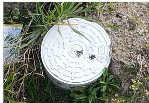
塩ビ製公共汚水柵 (直径20cm 塩ビふた)

※連絡先 岸和田市上下水道局下水道整備課 管理調整担当 TEL072-423-9650