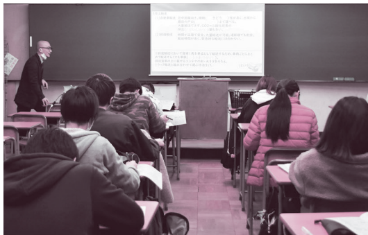
定時制授業の様子

語常識)と面接 合格発表 3月24日(水)午後2時に産業高校で 必要なもの 編入学願、検定料950円、在籍していた学校の単位修得証明書(高卒者は卒業証明書)・成績証明書、住民票の写し、府外在住者は勤務証明書 合格発表 3月26日(金)午後6時半に産業高校で 必要なもの 聴講願、顔写真(縦4.5cm×横3.5cm)1枚、審査料950円、住民票の写し、府外在住者は勤務証明書