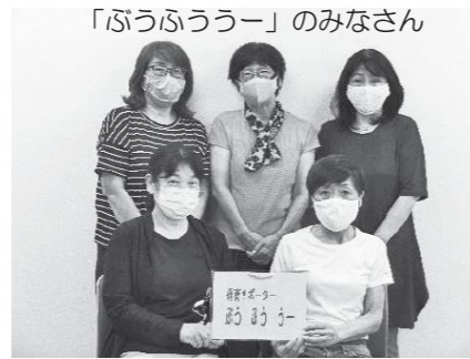
「ぶうふううー」のみなさん

私たちは出来るだけ身近な存在で居たいため、子どもたちと接する時は「先生」ではなく責任をもって対応する「おばちゃん」というスタンスで保育をしています。