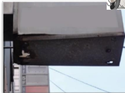
側板底部が腐食、破損