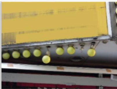
照明装置の破損、漏水