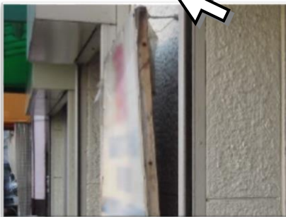
壁面取付け部の異常