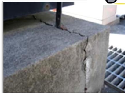
看板基礎部のひび割れ