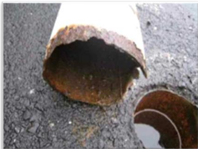
根腐れによる破断