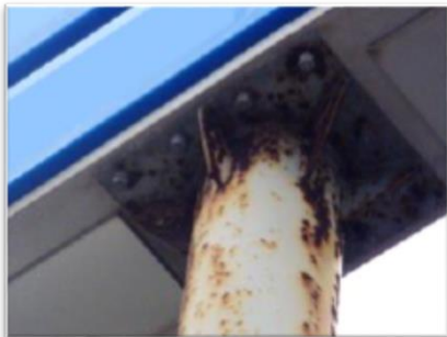
鉄骨接合部の腐食