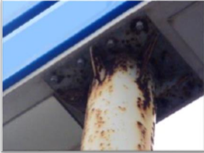
鉄骨接合部の腐食