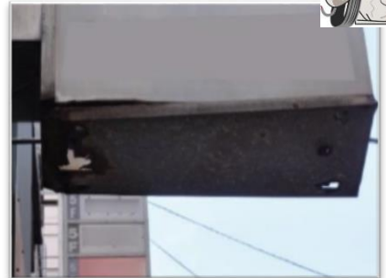
側板底部が腐食、破損