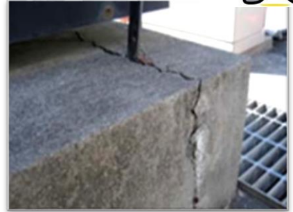
看板基礎部のひび割れ