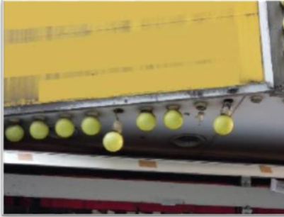
照明装置の破損、漏水