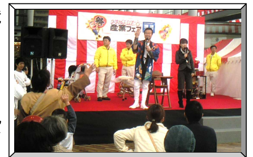
平成 20 年開催のオークション風景

環境フェアのブースでは、ペットボトルだんじりの展示や風車づくり体験、マジックショー、よさこいソーラン(予定)などを行います。