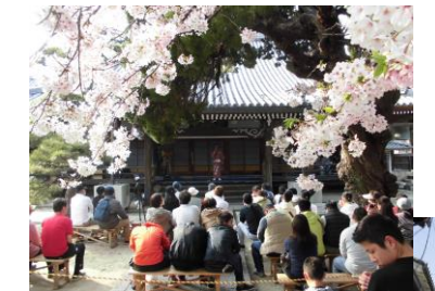
今年も賑わいました!

考える会が中心となって実行委員会を立ち上げ、多くの方の参画のもと行ってきた紀州街道にぎわい市は、おかげさまで21回目を迎えました。皆様のご協力により、多くの人で賑わい、好評のうちに実施することができました。