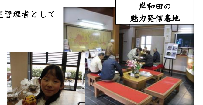
岸和田の魅力発信基地

まちづくりの館における展示や講座のお知らせをはじめ、本町地区やその周辺におけるイベントなど、随時情報発信を行っていますので、皆さん是非ご覧下さい。