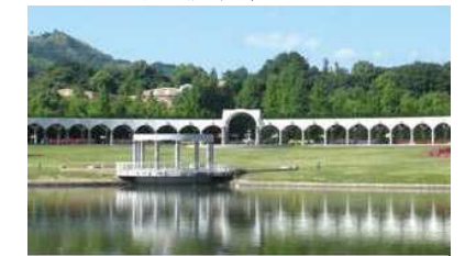
蜻蛉池(とんぼいけ)公園