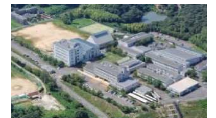
近畿職業能力開発大学校