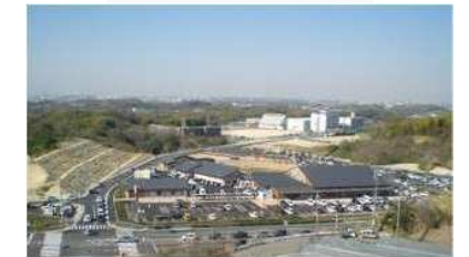
道の駅 愛彩ランド