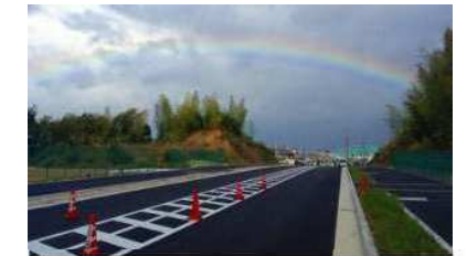
岸和田中央線（府道春木岸和田線）