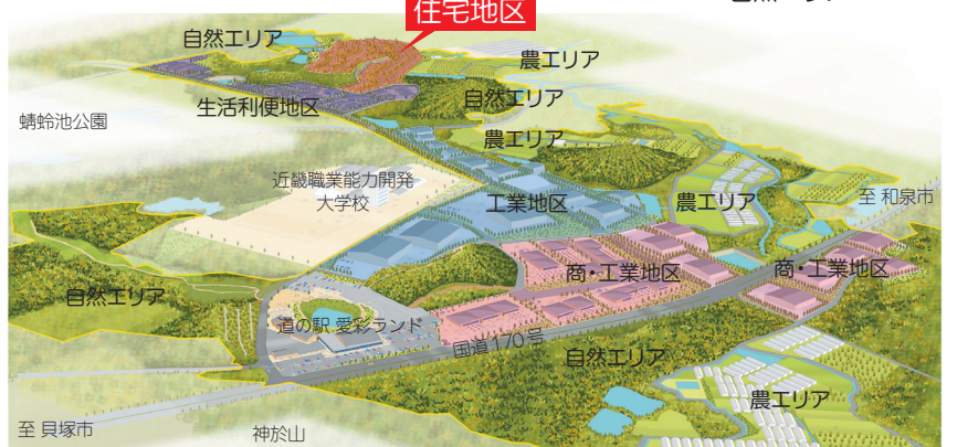
フクロウが生息する自然エリア