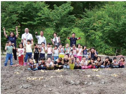
まちづくり協議会 ジャガイモ掘りの様子

「知りませんでした。企業や農業に携わっている人などがいろいろな活動をしているのを知って、ジャガイモ掘りやタケノコ掘りなどのイベントに参加したいなと思いました。」