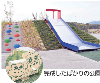
遊具にもゆめみヶ丘の象徴、フクロウが

「期待を込めてここに決めたので、期待していることばかりですが（笑）、バス停が近くに来てほしいですね。そして将来、「ゆめみヶ丘駅」が出来てほしいです。いい名前だと思いませんか（笑）。」