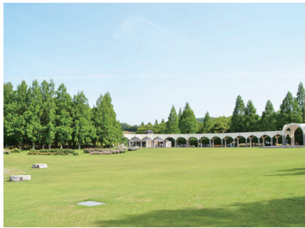
四季折々の自然が楽しめる蜻蛉池公園

「自然が好きなので、自然豊かな環境に魅力を感じました。駅は遠いですが、高速道路や幹線道路は近いので、車を利用する人には便利な場所だと思います。」