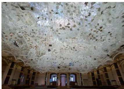
《クロスロード》2019年、展示風景: ホノルル・ビエンナーレ 2019、ハワイ Crossroads, 2019 installation view: Honolulu Biennial 2019, Hawaii