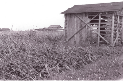
チーゼル畑とたまねぎ小屋(昭和30年頃) 繊維業が盛んだった頃、起毛に利用されたチーゼルも多く栽培されていました。右に見えるのは玉ねぎ小屋です。