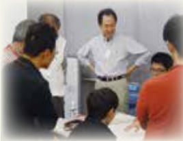
地域および自治体関連科目 租税法および関連科目