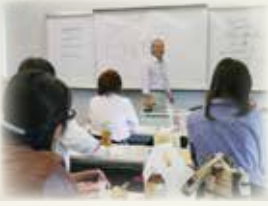
「西ヨーロッパの文学と社会」