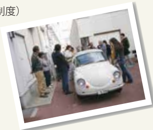
「地域環境・自然エネルギー革命」