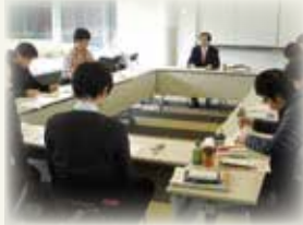
主に税理士資格の取得を目指す 大学院生を対象にした専門研究