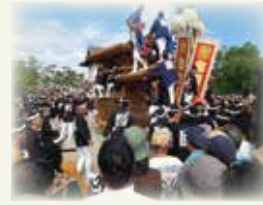
「連続テレビ小説『カーネーション』による経済効果の計測」