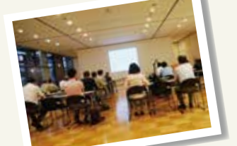
第 62 回「3R とエコライフ」