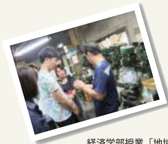
経済学部授業「地域調査研究」フィールドワーク