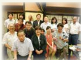
講演会後の交流会