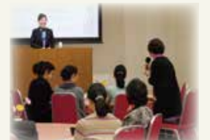
「女性のハッピーキャリア 応援のつどい」