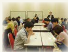
第 61 回 「百人一首カルタで学ぶ王朝和歌」

本学教員が地域の皆さんへ身近な研究テーマや旬のトピックスを解説し、自由な意見交換の時間も設けています。