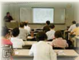
夏季講演会「岸和田とレンズ産業」