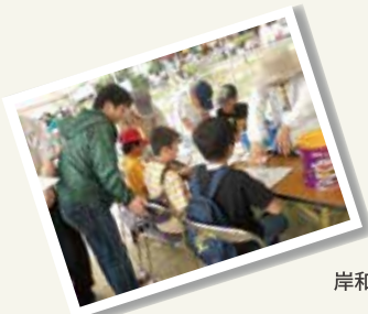
岸和田市民フェスティバル参加

会員相互の親睦と学びの交流を図るとともに、岸和田市ならびに周辺地域の活性化に意欲的に取り組んでいます。