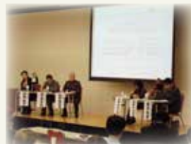
「ミドル期からの ライフデザインセミナーⅡ」