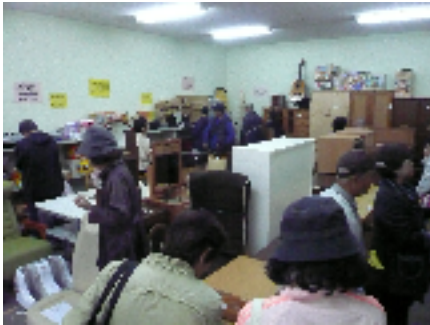
リユース品展示室の様子

平成30年11月14日（水）～15日（木）の2日間、環境事務所別館におきまして、市民の皆様よりご提供していただいたリユース品の無償譲渡会を開催しました。小型家具やベビー用品、小物等228点を展示また小物類の持ち帰りコーナーを設置し、2日間で333名の方々がご来場されました。16日（金）の抽選会当日も小物類の持ち帰りコーナーを設置、公開抽選では岸和田市消費生活研究会の方々のご協力のもと、応募のあった112点の公開抽選会を行い、当選者を決定しました。抽選会に来られた方の中にも当選者がおられ非常に盛り上がりました。