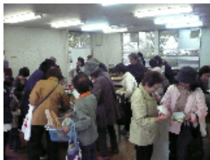
小物類持ち帰りコーナー