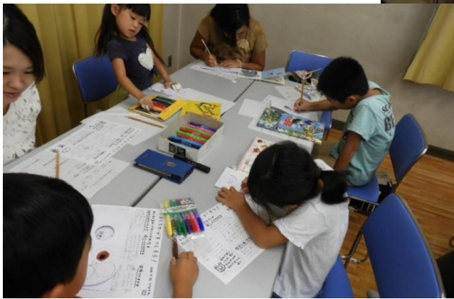
夏休み最後の思い出に、素敵なカードができあがりました。

日常のこんな場面ではこんなものを。年齢に応じて、遊び方を変えられる。など、わらべうたを生活に取り入れる実践的な内容でした。