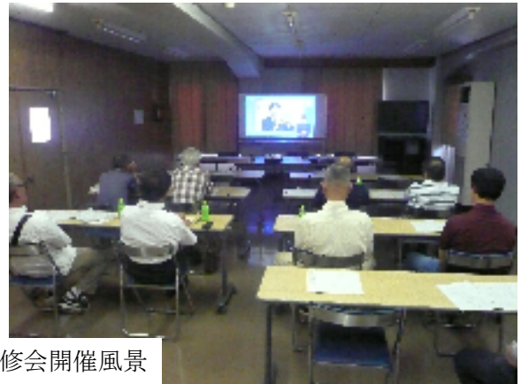
平成30年度の研修会開催風景