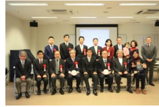
第4回 都市景観賞表彰式の様子

市内の良好な景観形成に貢献する建築物、工作物等の表彰を通じて、市民が「岸和田市のまちなみの魅力」について再発見し、これまで以上に市民と行政が協力して良好な景観形成を図る礎とすることを目的に市景観条例第40条に規定する表彰事業として平成14年度より取組を開始しています。表彰は、景観法第16条に規定される届出のあった大規模建築物等を対象とする「大規模建築物等届出部門」と、一般公募により推薦された建築物等を対象とする「一般公募部門」の2部門について実施し、過去4回の表彰事業における表彰した作品は以下のとおりとなります。