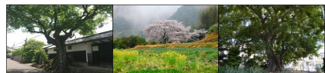
景観重要樹木 (2017/07/03 指定)

また、良好な景観の形成のための行為の制限に関する事項として、一定規模以上の開発行為等について届出を必要とすることや、景観重要建築物や景観重要樹木の指定方針、屋外広告物の表示及び掲出について定めています。