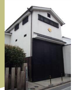
本町だんじり小屋

一里塚弁財天 江戸日本橋を中心とし全国の主な街道沿いに一里(約3.9km)ごとに設置された路呈標。旅人はここでしばしの休憩をとった。弁財天は寛治・寛文の頃からまつられるようになった。