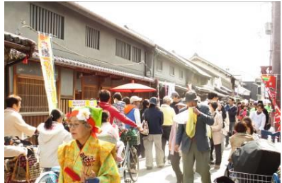
紀州街道にぎわい市