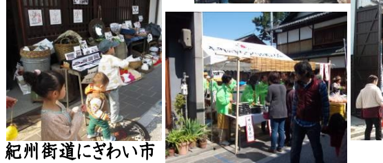
紀州街道にぎわい市