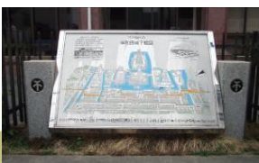
城下町絵図案内板

旧五十一銀行跡 本町は藩の御用商人が多く、紀州街道沿いに商家や卸問屋が軒を連ねた。これらの発展とともに五十一銀行も成長していった。