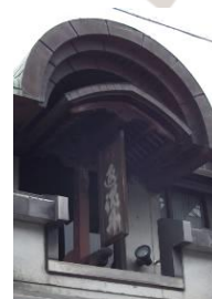
返魂丹 (薬種商の看板)