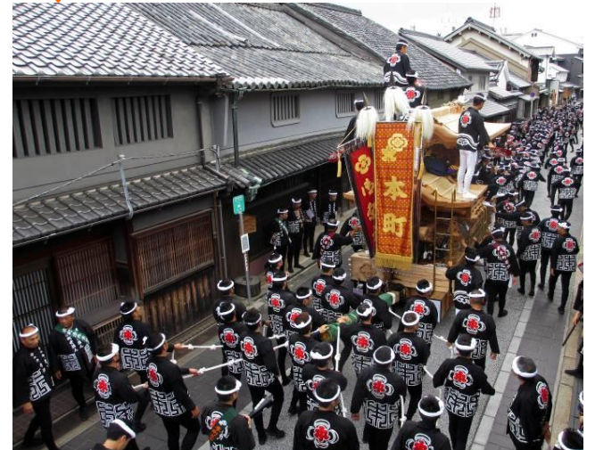
岸和田だんじり祭