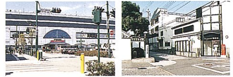
△岸和田市では、城下町をイメージさせる白や黒の無彩色が多く見られます。

色彩景観では、建築物等の色彩イメージとこれらの背景となる景観との整合性を図ることが大切です。