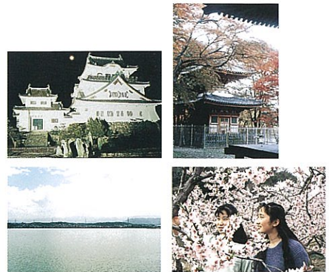
△岸和田市では南東部に山なみが連なるため逆光となりやすく、海側からはまちなみがややうす暗く感じられます。

人工物の色彩は、移り変わる自然の色彩の美しさが映える落ち着いた色彩や、飽きのこない色彩や、陰湿感や閉塞感を軽減する温もりのある色彩が望まれます。