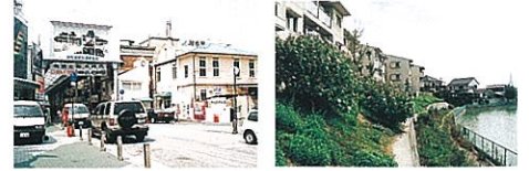
△岸和田市は、地形条件等の違いにより景観区ごとに色彩景観の特徴を見出すことができます。

色彩景観は、商業地、業務地、住宅地、工業地などの用途の違いや、市街地や郊外の環境特性により異なります。地域らしさが感じられる色彩景観とは、地域性や景観特性をどのように把握し、どのような色彩が望ましいかを検討することから始まります。