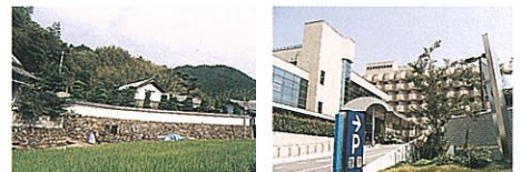
△土壁や板張り、石垣の暖色系や白壁や瓦の無彩色は市の伝統色となっています。

土や木材、石材などの自然素材は、自然景観と調和し地域になじむ色として人々にやすらぎを感じさせます。また、ステンレスやコンクリートなど人工素材と組み合わせることにより、まちなみに新鮮なイメージを与えます。しかし、樹木の緑、空や水の青等の自然の色やレンガ色などの自然素材を塗料等で模した人工素材は、自然のもつ風合いが感じられないので、取り扱いには十分な配慮が必要です。