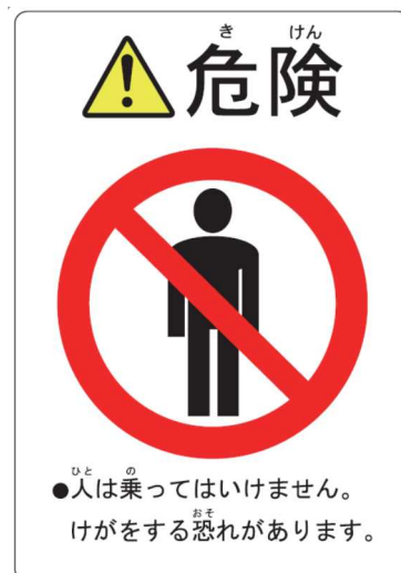
「搭乗禁止」ステッカーの例