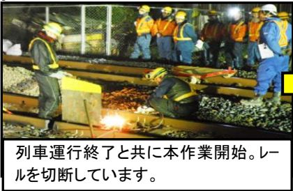
列車運行終了と共に本作業開始。レールを切断しています。