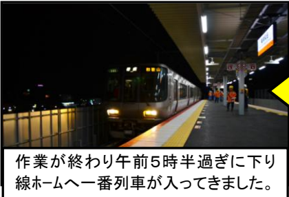
作業が終わり午前5時半過ぎに下り線ホームへ一番列車が入ってきました。