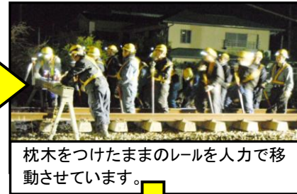
枕木をつけたままのレールを人力で移動させています。