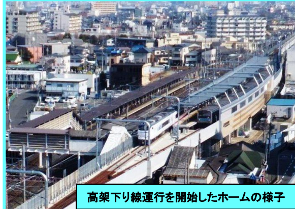
高架下り線運行を開始したホームの様子

下り線ホームでは、エレベーター、エスカレーターなどが設置されバリアフリーに対応したホームとなり、待合室なども整備され利便性が増しています。