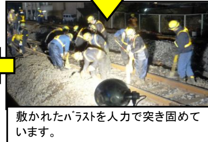
敷かれたバラストを人力で突き固めています。