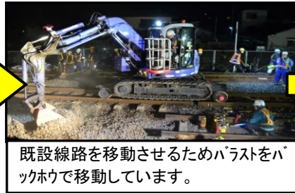
既設線路を移動させるためバラストをバックホウで移動しています。