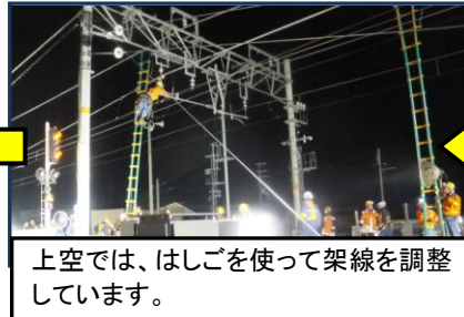
上空では、はしごを使って架線を調整しています。