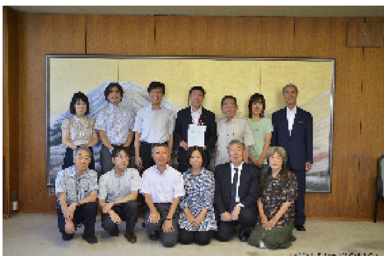
第3期自治基本条例推進委員会委員の皆さん (建議時に市長と)