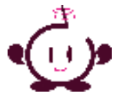
協働イメージキャラクター きっしー

今回の建議では、自治基本条例の各条項は本市にふさわしく社会情勢に適合しており、現時点で条項を追加規定する必要はないとされましたが、自治基本条例の各条項に基づく施策や制度等については、以下のとおり様々な分野に関して建議がありました。