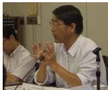
推進委員会の様子