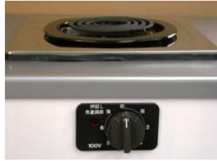
一口こんろ (前面操作) ※写真は富士工業製

身体や物が接触し、意図せずスイッチが「入」となる可能性がある構造であったために、電気こんろの上や周囲に可燃物が置かれていて、火災事故に至る危険性があります。