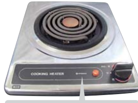
ブランド表示はHITACHIまたは、SunWave