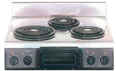
複数口こんろ (前面操作のみ)