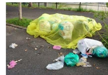
すき間があるから、ごみが荒らされる

ごみを出した後にかラスに狙われて荒らされるという相談が増えています。カラスは大変賢い生き物で、一度覚えてしまうと何度も狙われてしまいます。防鳥ネットを上手に活用しカラス等によるごみの散乱を防止しましょう。コツとしては、ごみ全体を覆うようにネットをかぶせ、ごみとごみのすき間をなくし、水の入ったペットボトルを数個用意し重りにしてごみネットが動かないように固定してください。