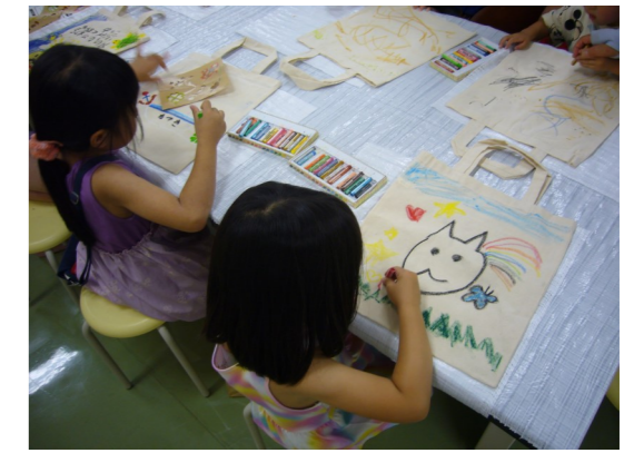
上手にバッグに絵を描くお子さんもいました。

来場していただいた皆様には、3Rに興味を持っていただき、日常生活の中で実践していただくきっかけになればと思います。