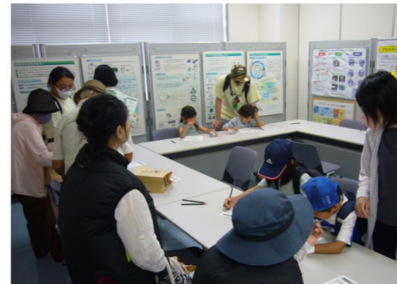
クイズも頑張って挑戦して頂きました。

今年の「3Rふれあいフェア」は、好天に恵まれ岸和田・貝塚市民合わせて725名の方々に来場して頂きました。岸和田市の催し、「3Rクイズに挑戦してオリジナルエコバッグを作ろう!」では、多くの皆様に参加して頂き、エコバッグを345枚を配布する盛況ぶりでした。