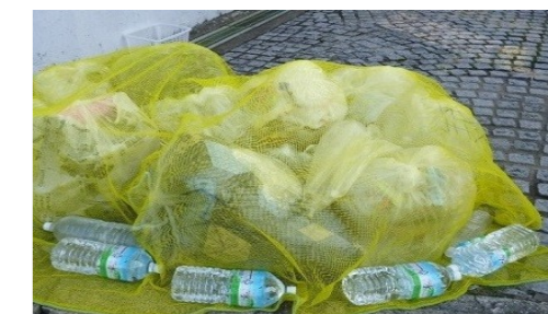
すき間なく重しをすれば、荒らされにくい