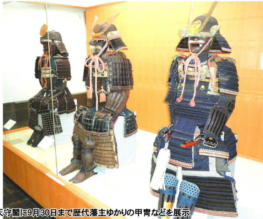
～岸和田藩の歴史を物語る～ 城天守閣に9月30日まで歴代藩主ゆかりの甲冑などを展示