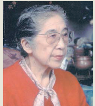
『大久保婦久子展』より

生まれ故郷である静岡県下田市は、その功績を讃えて、平成 12 年（2000）名誉市民の称号を贈りました。