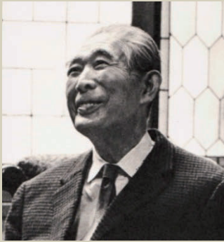
『大久保作次郎画集』より