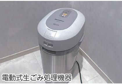
電動式生ごみ処理機器

家庭で生ごみの再資源化と減量のために家庭用生ごみ処理機器を購入した場合、費用の一部を補助します。購入後90日以内に申請してください。