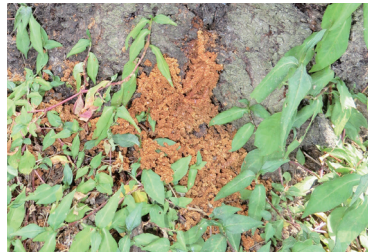
クビアカツヤカミキリのフラス

幼虫の糞・木くず・樹脂の混合物で中華麺～うどん状に固まります。このようなフラスが出ていたら、その木の中には幼虫がいます。