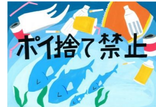
市長賞 久米田中学校 3年生