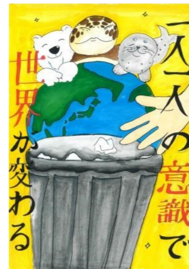
市長賞 朝陽小学校 6年生