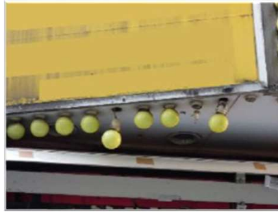
照明装置の破損、漏水