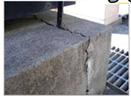
看板基礎部のひび割れ