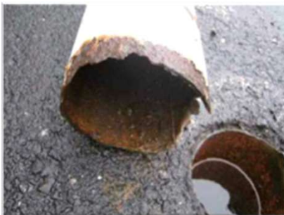
根腐れによる破断