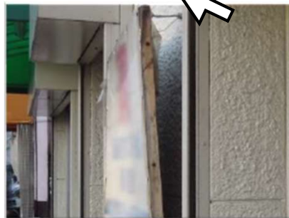
壁面取付け部の異常