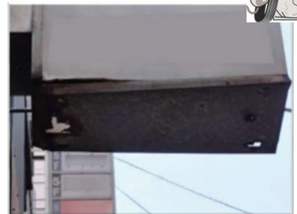
側板底部が腐食、破損