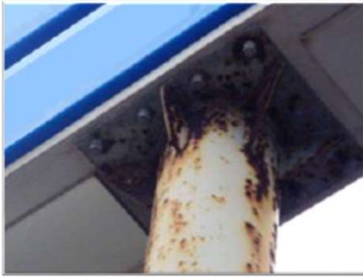
鉄骨接合部の腐食