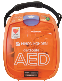
自動体外式除細動器(AED)