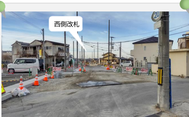
府道から西側改札方面を望む

歩道などの道路形態が出来つつあります。 府道から西側改札まで見渡せるようになりました。