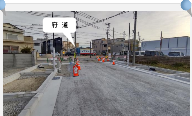
西側改札から府道方面を望む