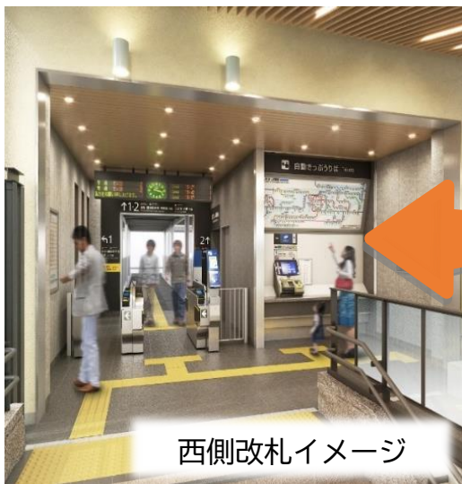
西側改札イメージ