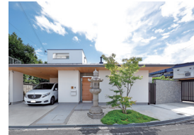
▲奨励賞「上町の岸田邸」