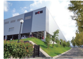
◀奨励賞 「株式会社イケ 本社工場」 (岸の丘町2丁目)