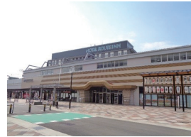
▲都市景観賞「JR東岸和田駅 駅舎(西日本旅客鉄道株式会社)」(土生町4丁目)