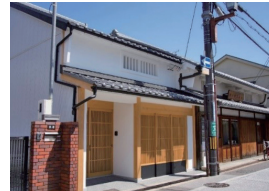
▲都市景観賞「本町の芝邸」