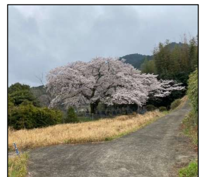
こころに残る樹木景観 塔原町・サクラ（景観重要樹木）