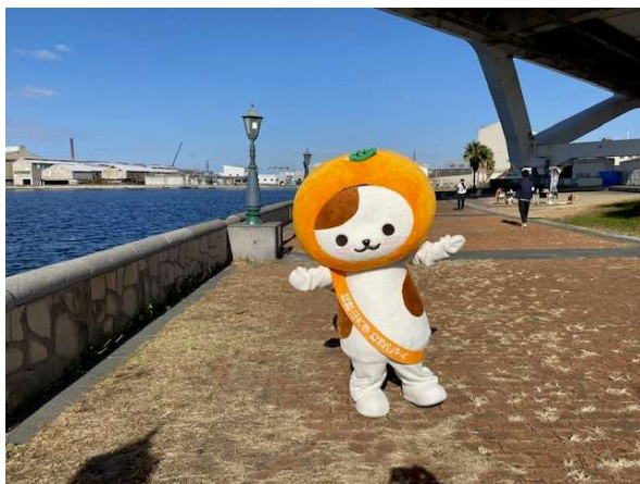
ここに残るみち景観 岸和田港を臨むみち