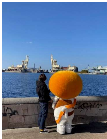
ここに残る眺望景観 カンカンバイサイドの岸和田水門