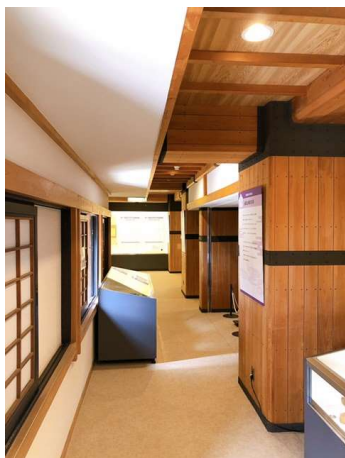
柱と柱の間に展示ケースを置く展示