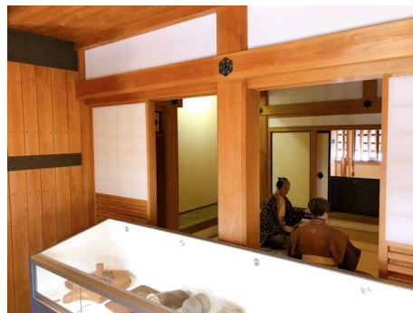
人形を使った展示