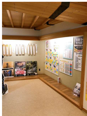
シティーセールスに関する展示