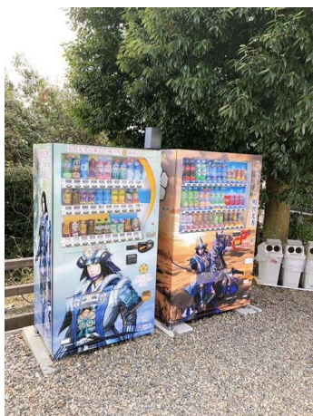
明智光秀ラッピングの自動販売機