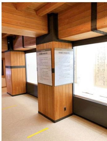
柱に直接パネルを設置する展示