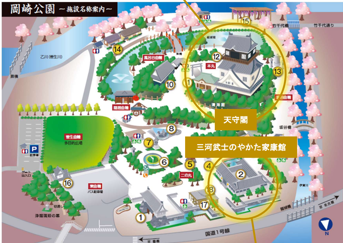
案内マップ