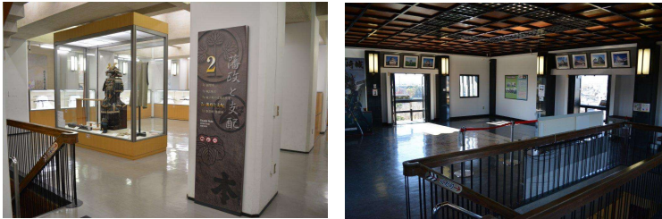
天守閣展示（愛知県岡崎市公式観光サイトより引用）