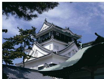
愛知県岡崎市公式観光サイト より引用