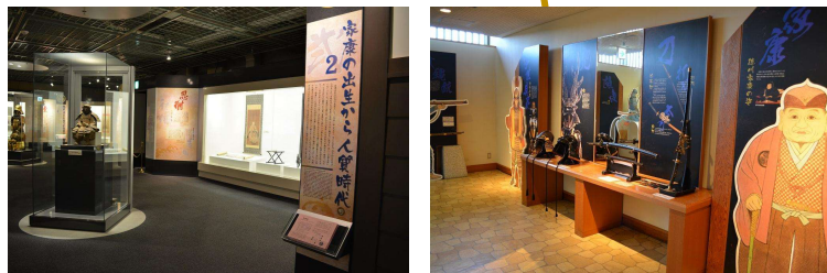
三河武士のやかた家康館展示