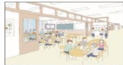
多目的スペースの活用による多様な学習活動への柔軟な対応