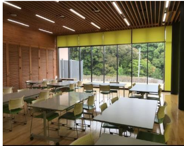
ランチルーム(和泉市南松尾はつがの学園)