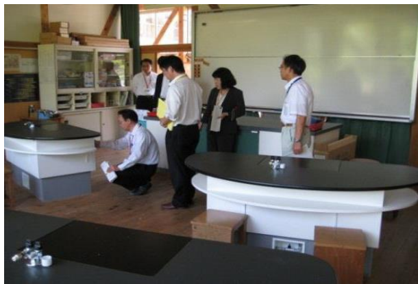
机高が可変できる理科室(佐賀市小中一貫校北山校)

体格差や学年区切りに応じた校舎整備を図るとともに、屋外活動では低学年用の遊具スペースや、サブグラウンドを整備し、部活動時や休み時間の動線を区別します。