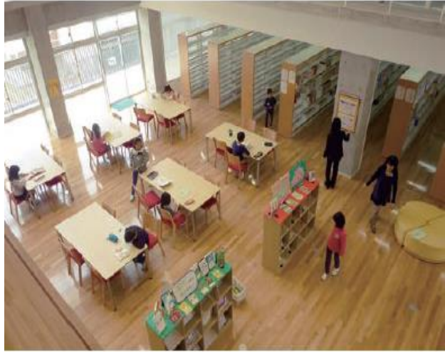
小中共用図書室(つくば市春日学園)