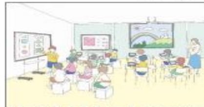
1人1台端末環境等に対応したゆとりある教室の整備