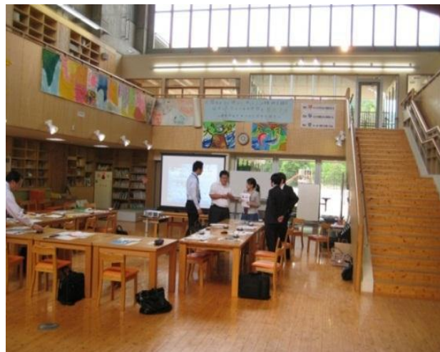
1階中央の異学年交流の場(京都市花背小・中学校)