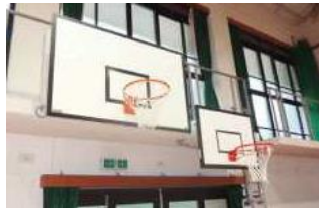
高さの異なるバスケットゴール(京都市京都大原学院)