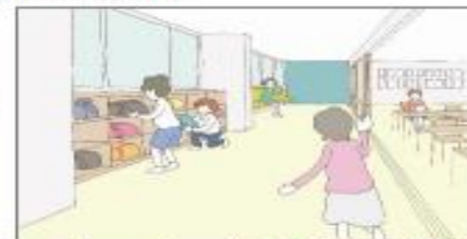
ロッカースペース等の配置の工夫等による教室空間の有効活用