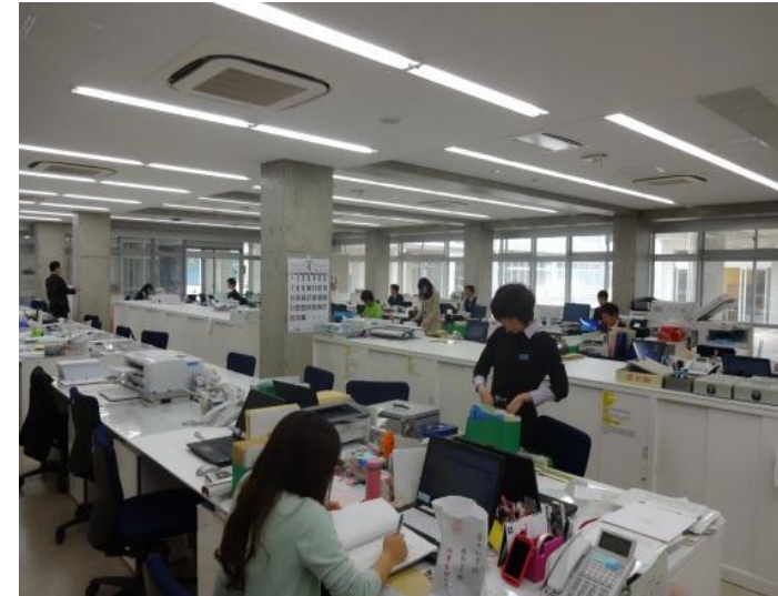
小中合同の職員室(つくば市春日学園)