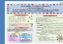
リーフレット(A4両面1枚)