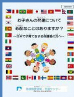
ばんふれっと パンフレット(22ページ)

はったつしょうがいじょうほう しえんせんたー 発達障害情報・支援センター こうしん ねん がつ [更新 2022年4月]