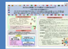
リーふれっと ペーじ リーフレット(2ページ)

こーど から、それぞれのがいこくごばんふれっと QRコードから、それぞれの外国語パンフレットをみてください