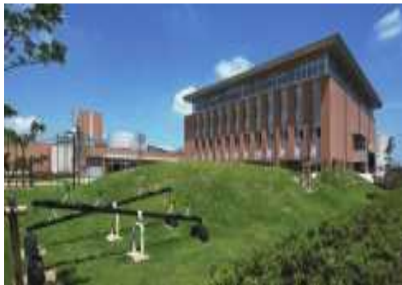
低学年用の芝生広場(飛島村飛島学園)