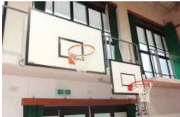
高さの異なるバスケットゴール(京都市京都大原学院)