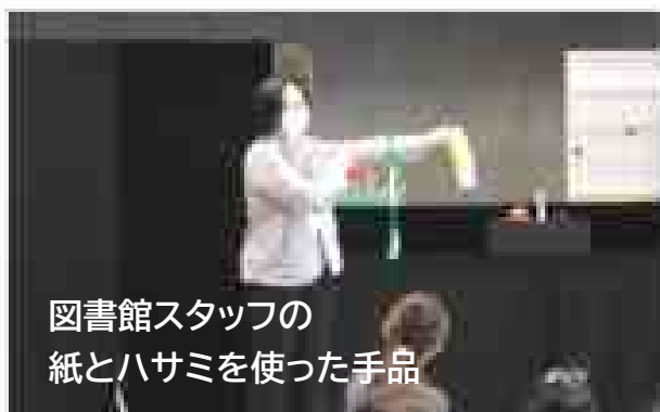
図書館スタッフの 紙とハサミを使った手品