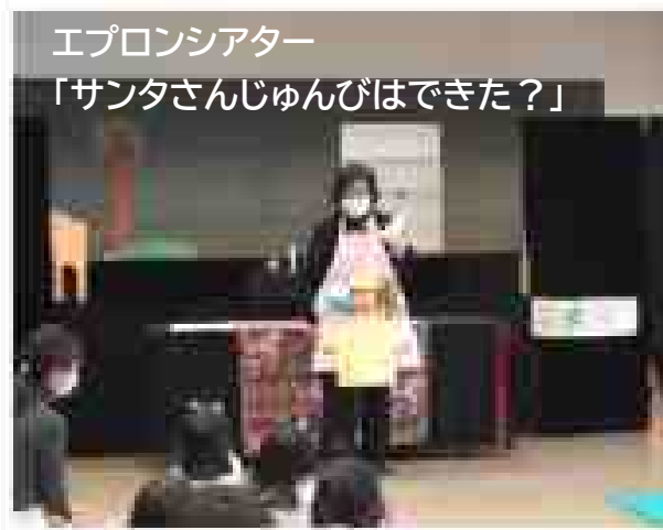
エプロンシアター 「サンタさんじゅんぴはできた？」