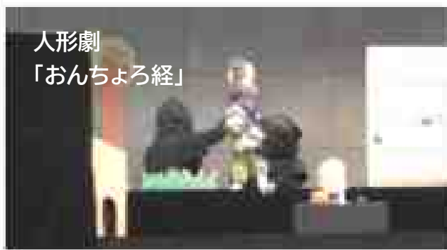
人形劇 「おんちよろ経」