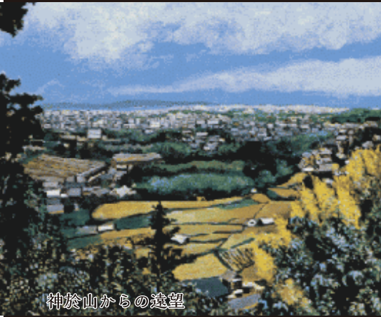
神於山からの遠望