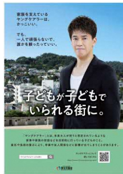
ポスター・リーフレット（表）

ヤングケアラーの周りにはいる方々が当事者の状況に気付き、声をかけ、手を差し伸べていくことで、ヤングケアラーが「自分は一人じゃない」「誰かに頼ってもいいんだ」と思える「子どもが子どもでいられる街」を社会全体で実現するため、ポスター・リーフレットを作製しました。今後、都道府県、市区町村、学校などに幅広く配布をしていく予定です。