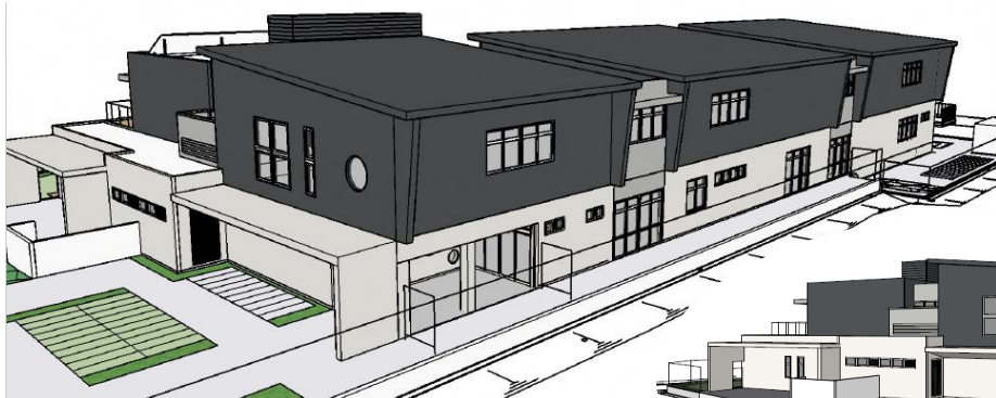
園舎（北東側）のイメージ