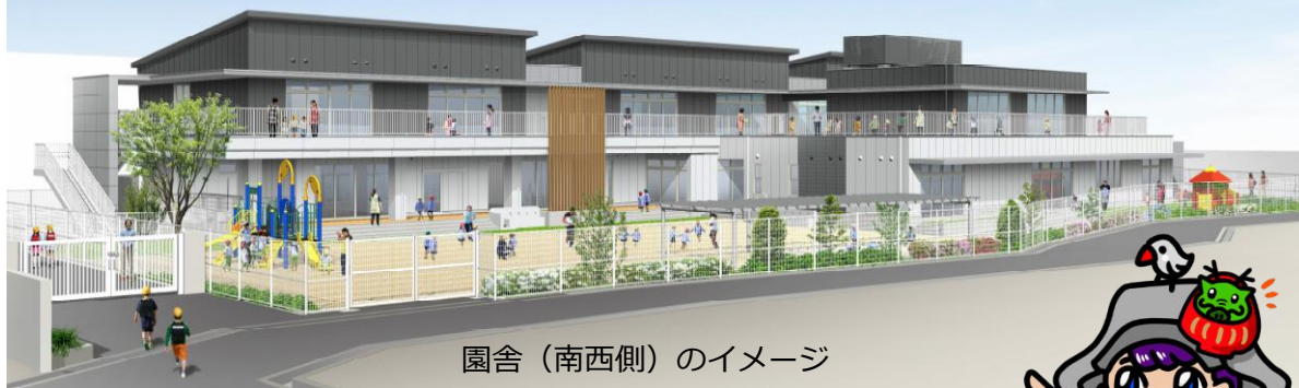
園舎（南西側）のイメージ