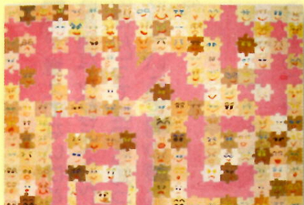
新条小学校 6年 児童作品