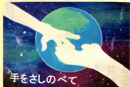
光陽中学校 1年 生徒作品