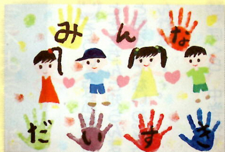
八木北小学校 1年 児童作品