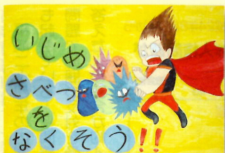
大宮小学校 5年 児童作品