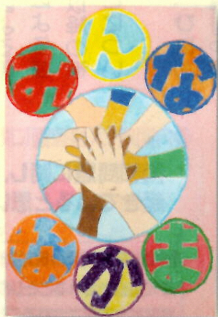
旭小学校 2年 児童作品