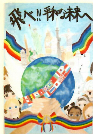
岸城中学校 2年 生徒作品