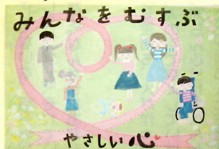
大宮小学校 3年 児童作品