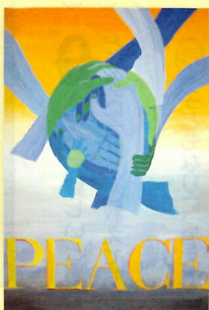
産業高等学校 1年 生徒作品