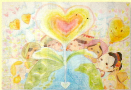
城内小学校 4年 児童作品