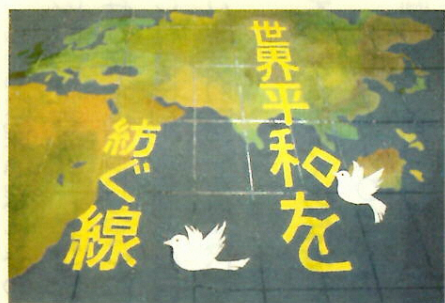
山滝中学校 3年 生徒作品