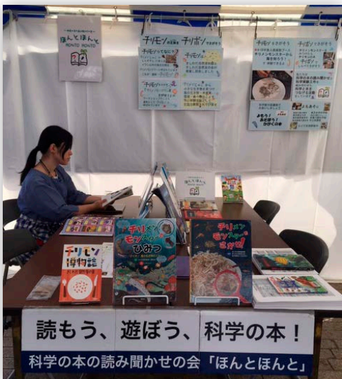
東京湾大感謝祭でのブース出展（2018年）